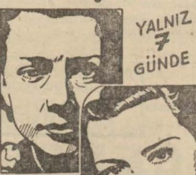
Boyun O. Bramamalle Fotoğrafları

Bu. İnanılmaz gibi görünüyor. fakat, BİZZAT TECRÜBE EDİNİZ.